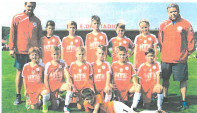
TJ Sokol Novosedly U – 11 E.ON Junior Cup 2016

Jak dopadlo velké finále E.ON Junior Cupu celkově?