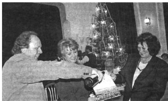
Fotografie: 2x křest knihy "Vinařská obec Novosedly"