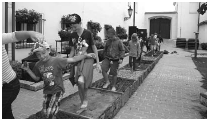
Fotografie: 4x příměstský tábor